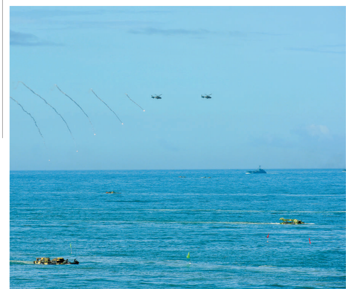
南部战区积极探索培育联合文化,使联合作战效益得到更为充分的释放。