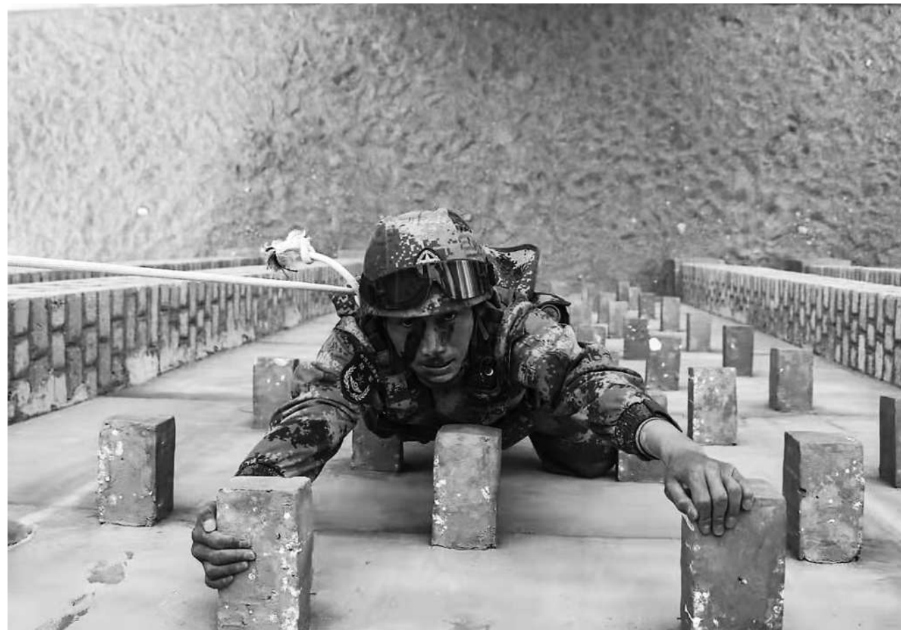
5月13日,驻守在“生命禁区”的西藏阿里军分区某部组织官兵开展攀登、滑降等课目训练,提升官兵技战术水平,锤炼官兵在高寒缺氧环境下遂行多样化军事任务能力。图为攀登训练现场。