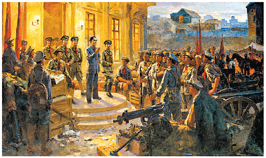
下图：油画《南昌起义》(局部)