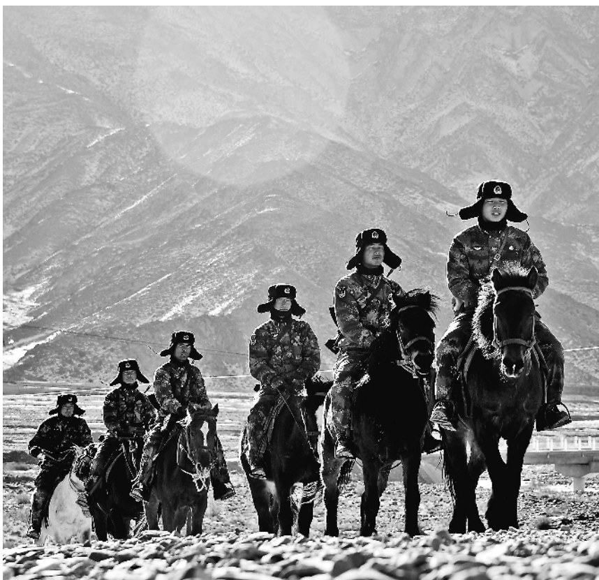
1月14日,驻守在帕米尔高原的新疆克孜勒苏军分区迈丹边防连巡逻分队,在党员骨干带领下,赴海拔3667米的阔尔盖别里山口执行巡逻任务。

习主席向全军发布训令后,支队全体官兵在党员队伍的示范带动下,按照“坚持提高军事训练实战化水平”要求,高标准开展训练。近日,结合执行护航、演训等任务,支队海口舰士官李明等党员骨干主动请缨组织主炮技能比武挑战赛。活动中,他们帮助新舰员补齐能力短板,先后强化了7个技能弱项,进一步调动了官兵训练热情。